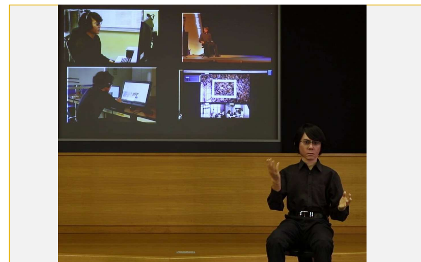
ユーザ本人よりホスピタリティ豊かな動作を表出しながら講演する